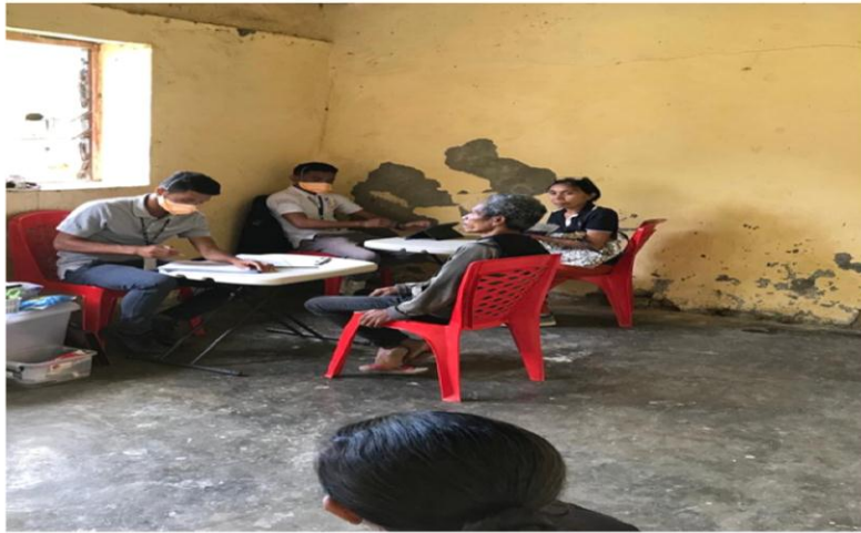
Meja III: Meja Skriing/Anamesa atu rekolla sputung.