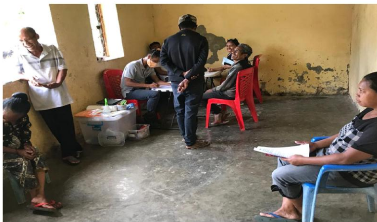
Meja IV: Rekolla escarros /catarros (sputung).